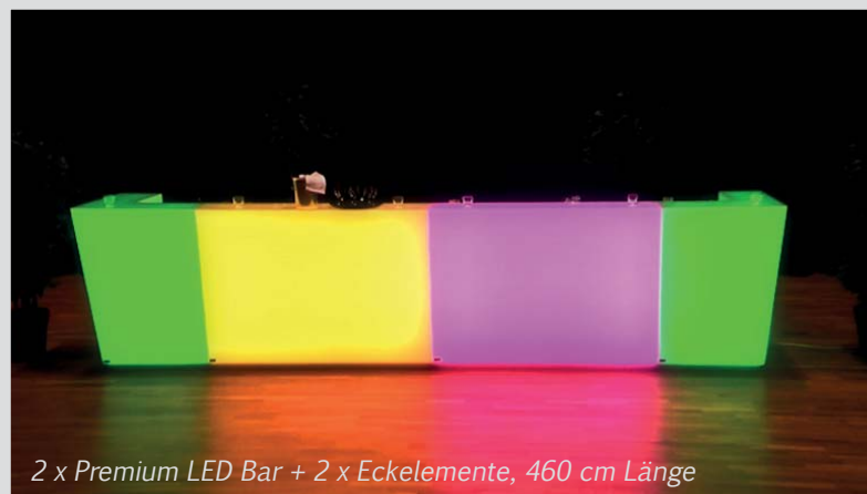
2 x Premium LED Bar + 2 x Eckelemente, 460 cm Länge